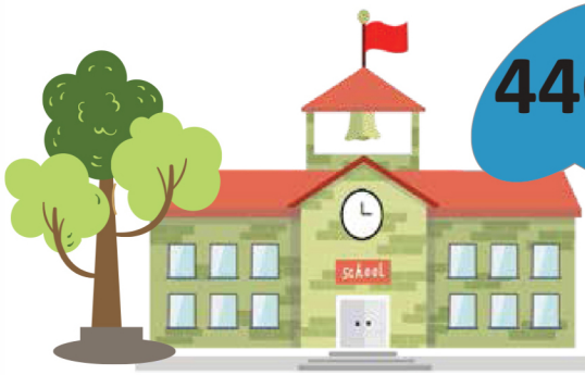
Trường học - School